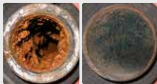
Biofilme em um sistema de tubulação