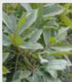
Plantas em estufa